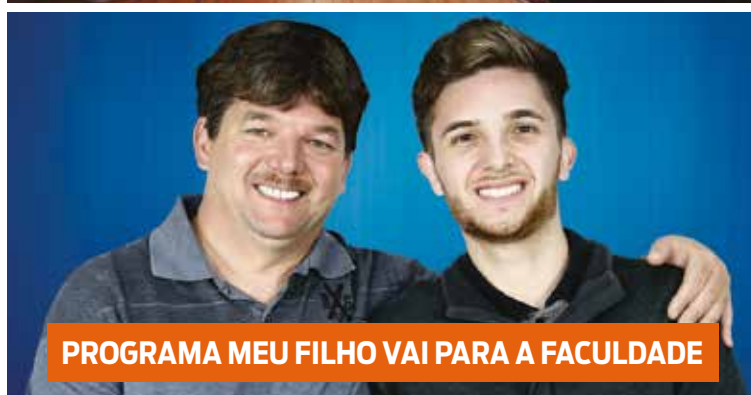
PROGRAMA MEU FILHO VAI PARA A FACULDADE