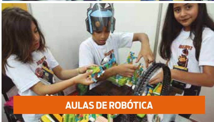
AULAS DE ROBÓTICA