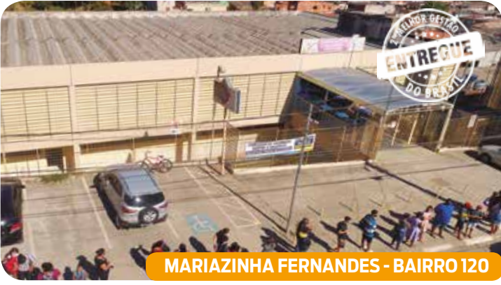
MARIAZINHA FERNANDES - BAIRRO 120