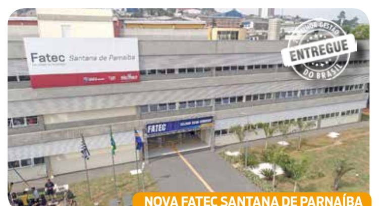
NOVA FATEC SANTANA DE PARNAÍBA