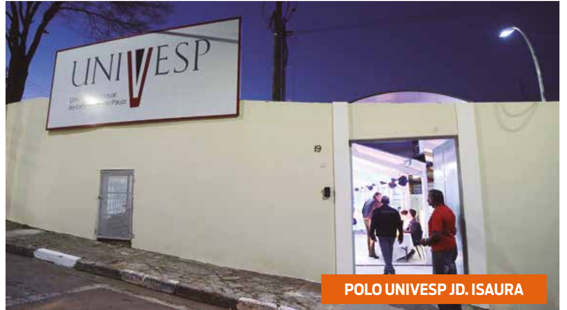
POLO UNIVESP JD. ISAURA

Construção do Complexo da Educação com integração de serviços e gestão de ensino vai gerar economia de gastos com aluguéis