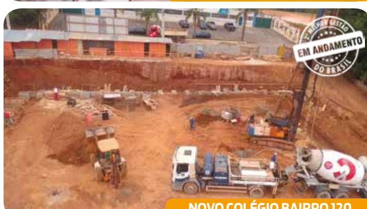
NOVO COLÉGIO BAIRRO 120