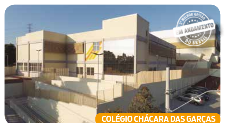
COLÉGIO CHÁCARA DAS GARÇAS