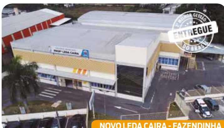
NOVO LEDA CAIRA - FAZENDINHA