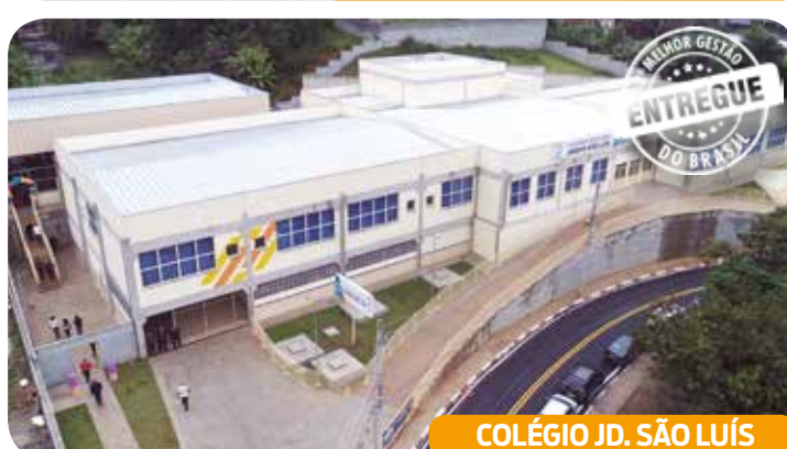
COLÉGIO JD. SÃO LUÍS