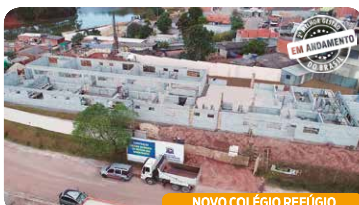
NOVO COLÉGIO REFÚGIO