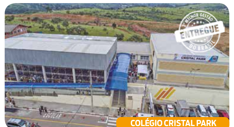
COLÉGIO CRISTAL PARK