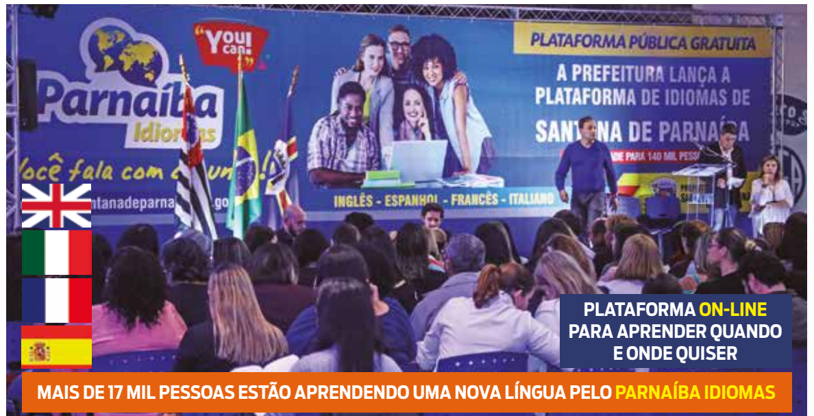
MAIS DE 17 MIL PESSOAS ESTÃO APRENDENDO UMA NOVA LÍNGUA PELO PARNAÍBA IDIOMAS