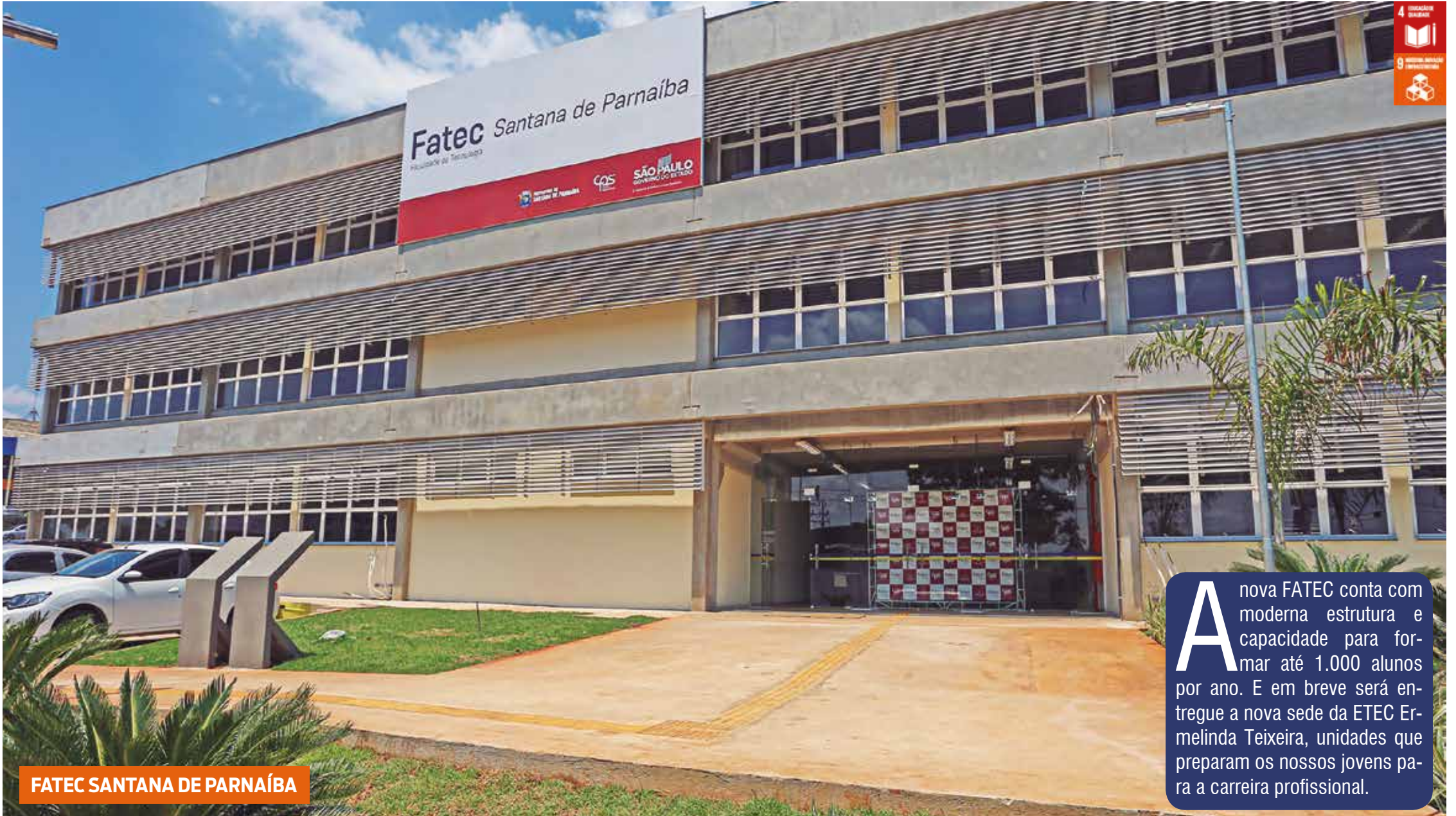
FATEC SANTANA DE PARNAÍBA

A nova FATEC conta com moderna estrutura e capacidade para formar até 1.000 alunos por ano. E em breve será entregue a nova sede da ETEC Ermelinda Teixeira, unidades que preparam os nossos jovens para a carreira profissional.