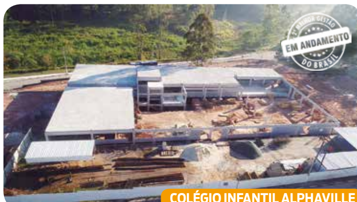
COLÉGIO INFANTIL ALPHAVILLE