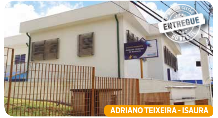
ADRIANO TEIXEIRA - ISAURA