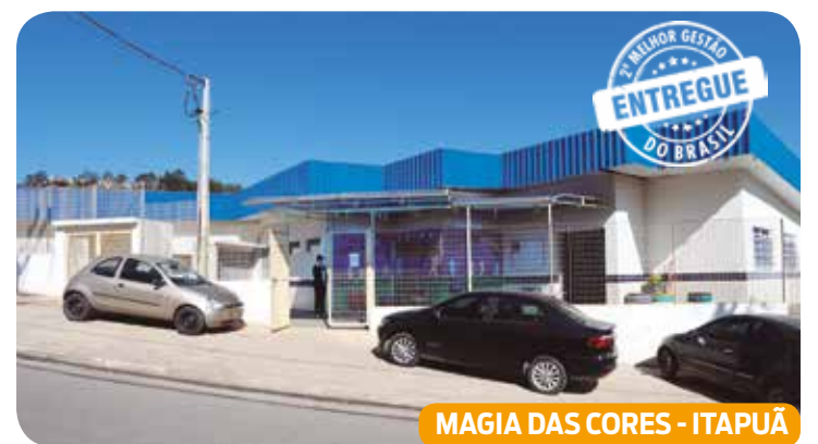
MAGIA DAS CORES - ITAPUÁ