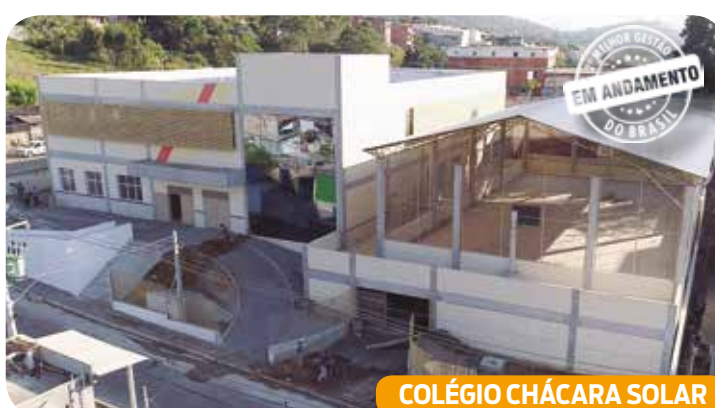
COLÉGIO CHÁCARA SOLAR