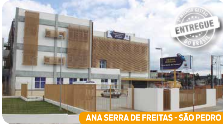
ANA SERRA DE FREITAS - SÃO PEDRO