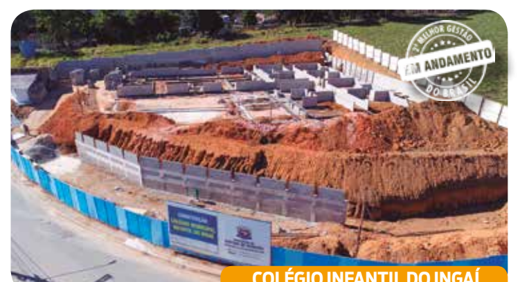
COLÉGIO INFANTIL DO INGAÍ