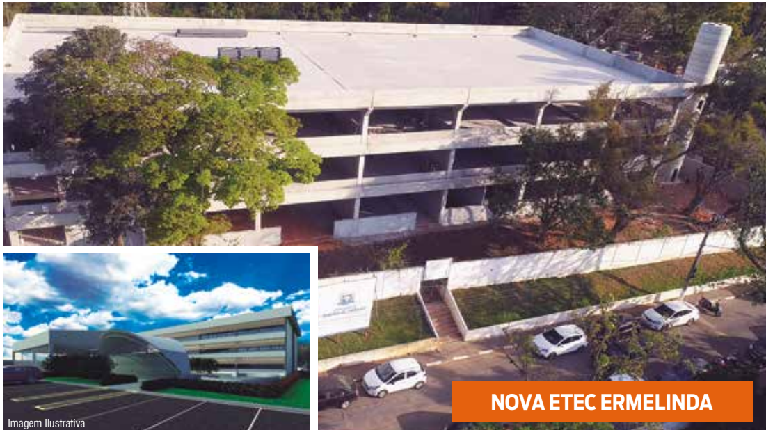
NOVA ETEC ERMELINDA

A nova FATEC conta com moderna estrutura e capacidade para formar até 1.000 alunos por ano. E em breve será entregue a nova sede da ETEC Ermelinda Teixeira, unidades que preparam os nossos jovens para a carreira profissional.