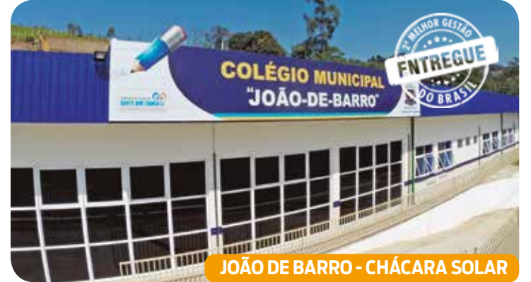
JOÃO DE BARRO - CHÁCARA SOLAR