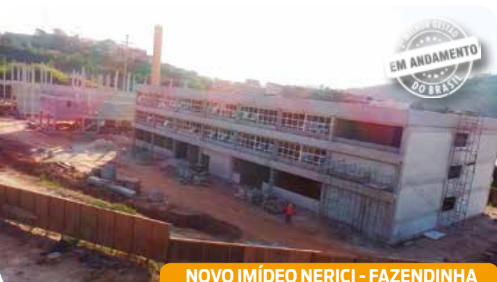
NOVO IMÍDEO NERICI - FAZENDINHA