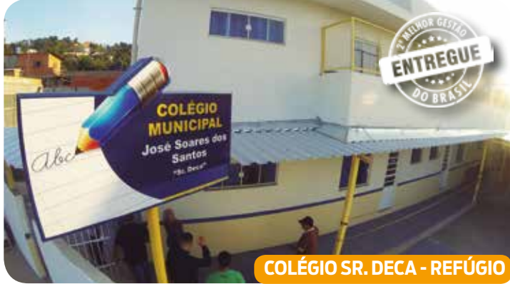
COLÉGIO SR. DECCA - REFÚGIO