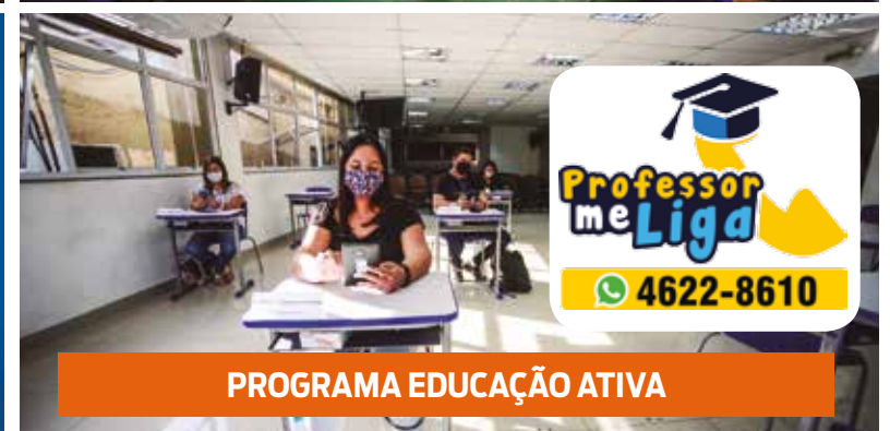
PROGRAMA EDUCAÇÃO ATIVA