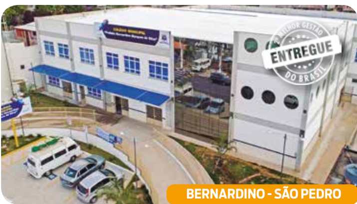
BERNARDINO - SÃO PEDRO