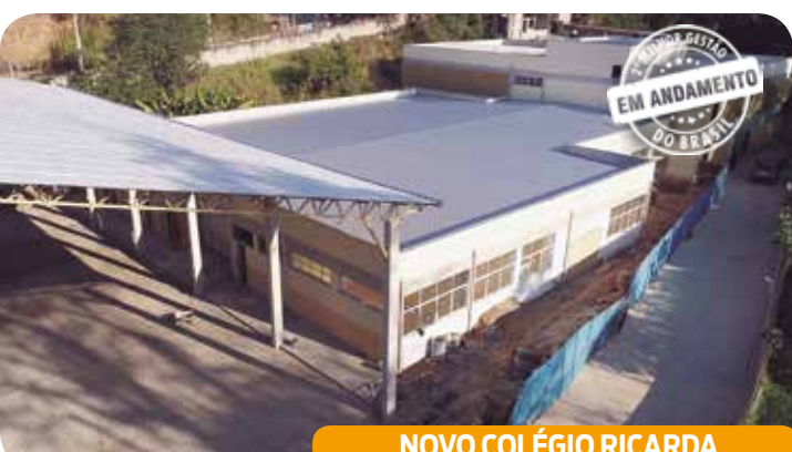
NOVO COLÉGIO RICARDA