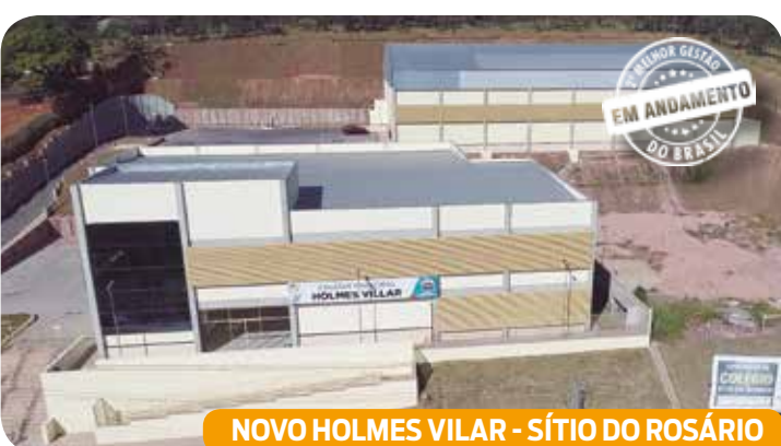
NOVO HOLMES VILAR - SÍTIO DO ROSÁRIO