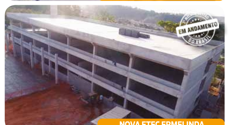
NOVA ETEC ERMELINDA