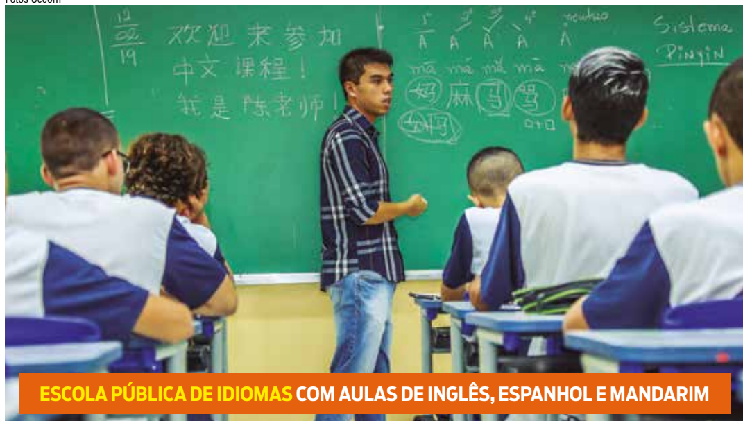
ESCOLA PÚBLICA DE IDIOMAS COM AULAS DE INGLÊS, ESPANHOL E MANDARIM